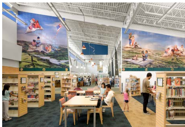
乔斯·桑塞斯 (Jos Sances) 收藏在本縣卡斯特羅谷圖書館的藝術品，是阿拉米達縣藝術收藏的一部分。

鑒於縣設施為居民提供許多基本服務，我們將採取措施，使我們的建成環境能夠抵禦氣候風險，例如在樓宇中增加蓄電池組，以便設施在停電期間正常運行。